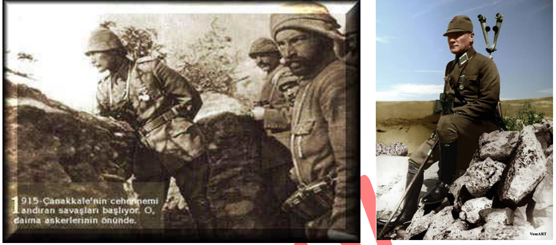
Resim 2.1. Türkiye Cumhuriyeti Devleti'nin kurucusu Mustafa Kemal Paşa'nın Çanakkale ve Kurtuluş Savaşları sırasında cephede savaşı izleme ve gözetme çalışmaları